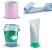
Embalagens e tubos