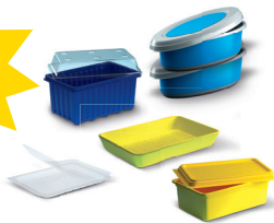
Caixas e recipientes